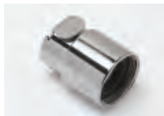
■ TAP22FN senza valvola