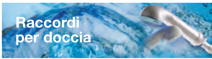
Raccordo per doccia, 1/2 pollice, filetto maschio