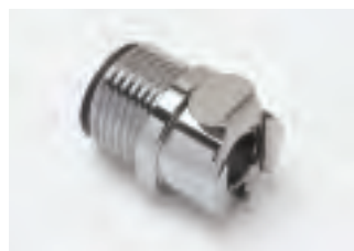
■ TAP1/2MN senza valvola