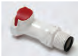
■ SHO1/2MNN senza valvola, senza riduzione