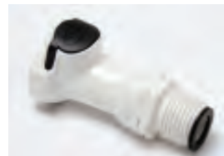
■ SHO1/2MVN con valvola, senza riduzione