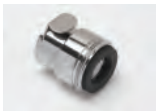
■ TAP24MV con valvola