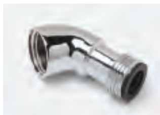
■ E135 raccordo a gomito