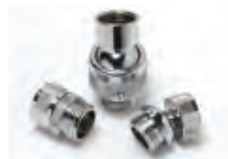
■ Contattare l'ufficio commerciale – Raccordi con snodo