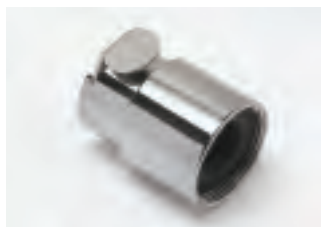
■ TAP22FV con valvola