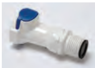
■ SHO1/2MNR senza valvola, con riduzione