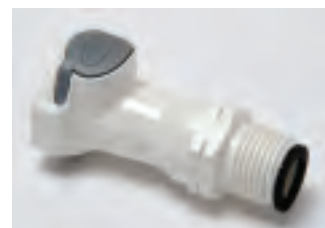
■ SHO1/2MVR con valvola, con riduzione