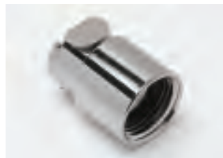
■ TAP1/2FN senza valvola