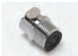
■ TAP1/2MV con valvola