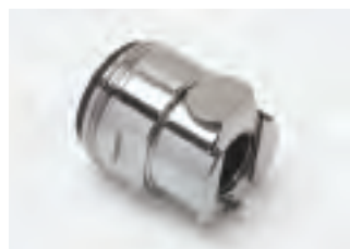
■ TAP24MN senza valvola