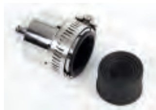
■ TAPUC con valvola