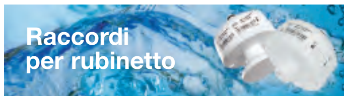
Raccordo per rubinetto, 1/2 pollice, filetto femmina